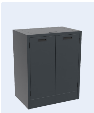
Artikelnr. 132B0011-B-7016-7016 Avfallsskåp för egna behållare (med "visuell" sockel på luckorna) Utvändigt mått mm: H:1120 B:900 D:600