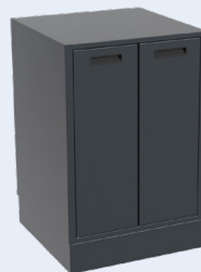
Artikelnr. 142H0016-B-7016-7016 Avfallsskåp förberett för behållare Utvändigt mått mm: H: u/sockel 790 m/sockel 920 B:600 D:600