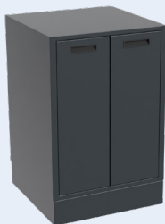
Artikelnr. 132B0012-B-7016-7016 Avfallsbehållare med 4 fack Utvändigt mått mm: H: u/sockel 790 m/sockel 920 B:600 D:600