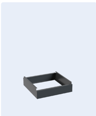
Artikelnr. 118D0360-7016 Stängd sockel Monterad.H:130 mm Utvändigt mått mm.: H:168 B:600 D:600